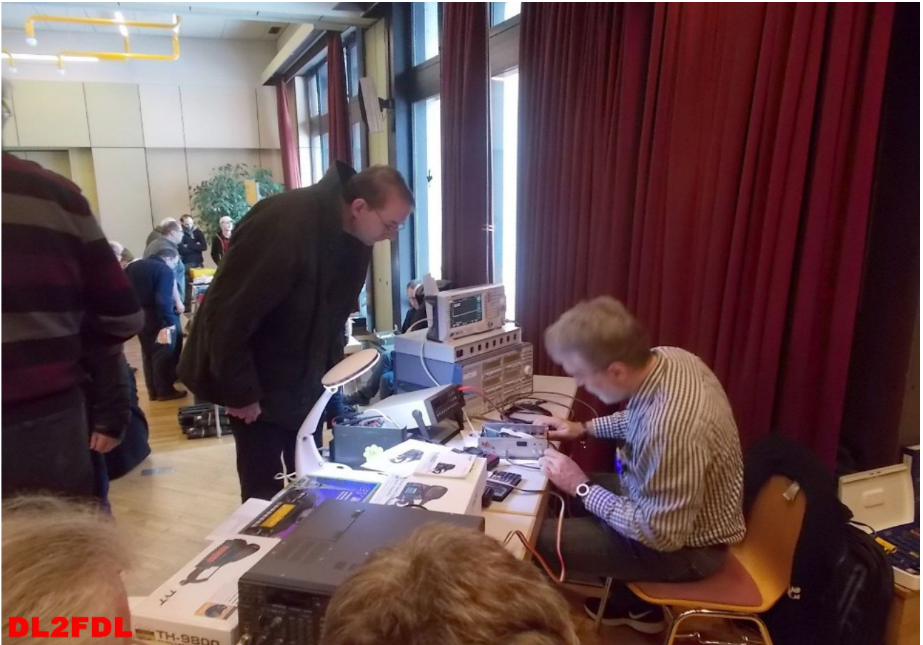
DL2FDL DC3AX, Uli am Messplatz