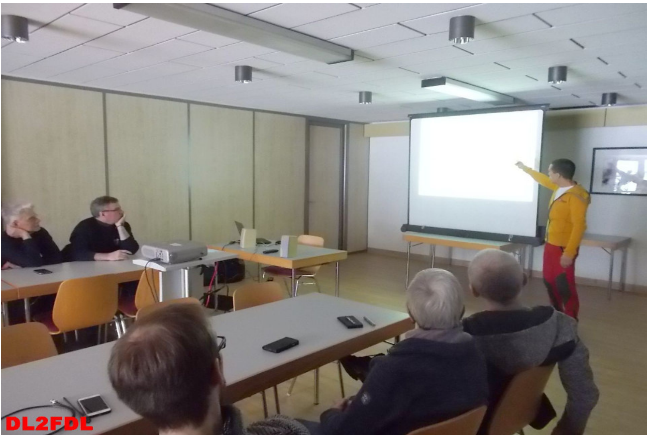
Ansage des nächsten Fachvortrages.