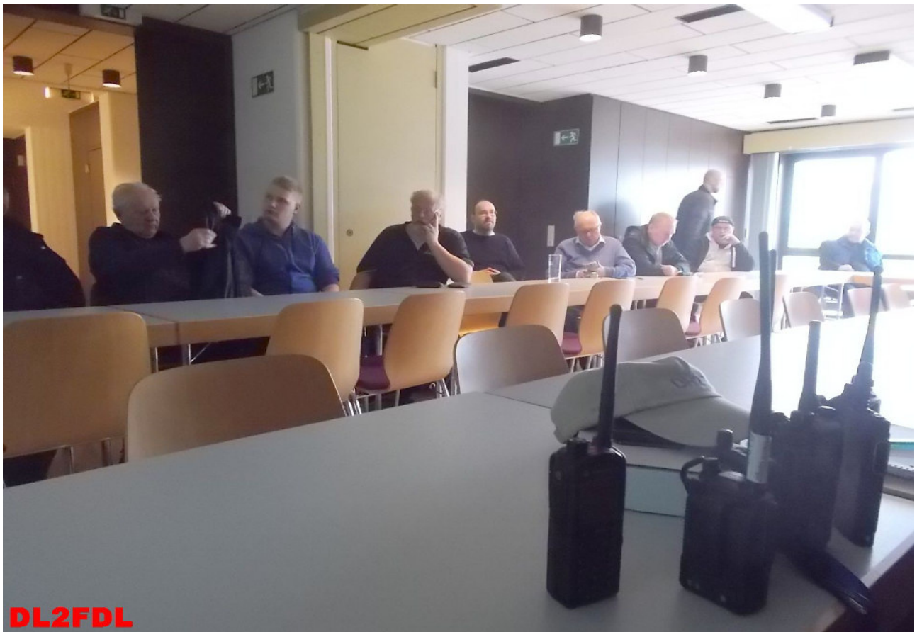
Zweiter Vortrag, DH9FAX, Reiner Digitaler Sprechfunk D-STAR, Tetra, DMR und Fusion.